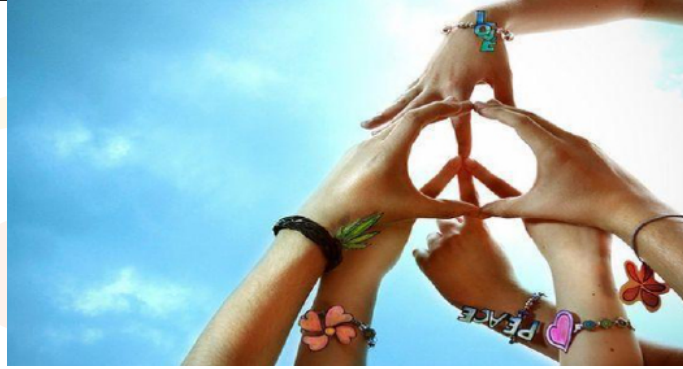
Immagine 2. Pace.