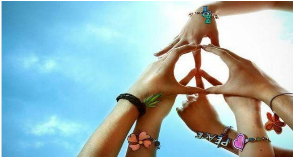
Фигура 2. Фотография на мира от Фер Грегъри