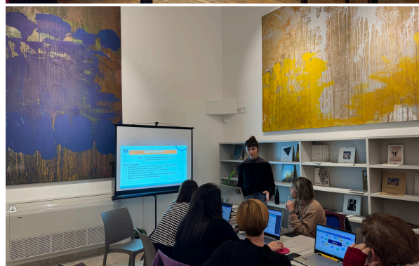
Фотографии од пилот тестирањето во различни држави