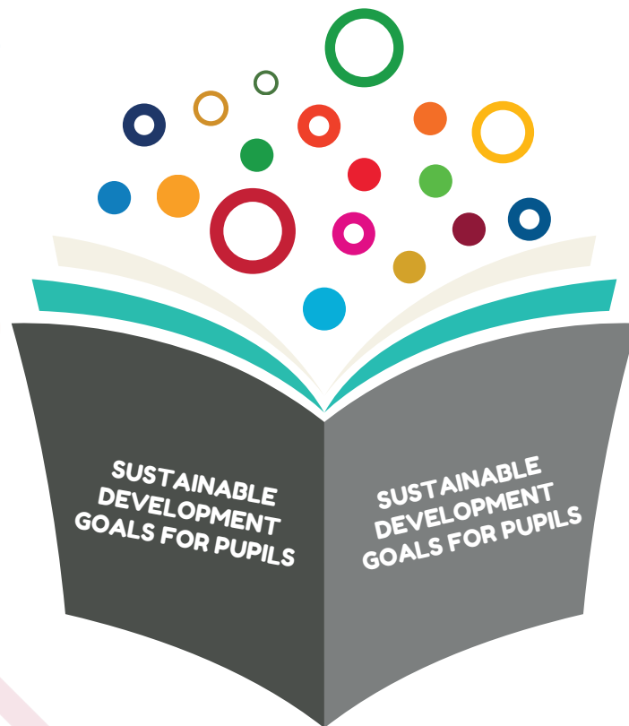
Figura 2. Logo del progetto

Durante l'incontro, Eco-Logic ha presentato diverse proposte per il logo del progetto; il seguente logo è stato scelto dalla maggioranza dei partecipanti: