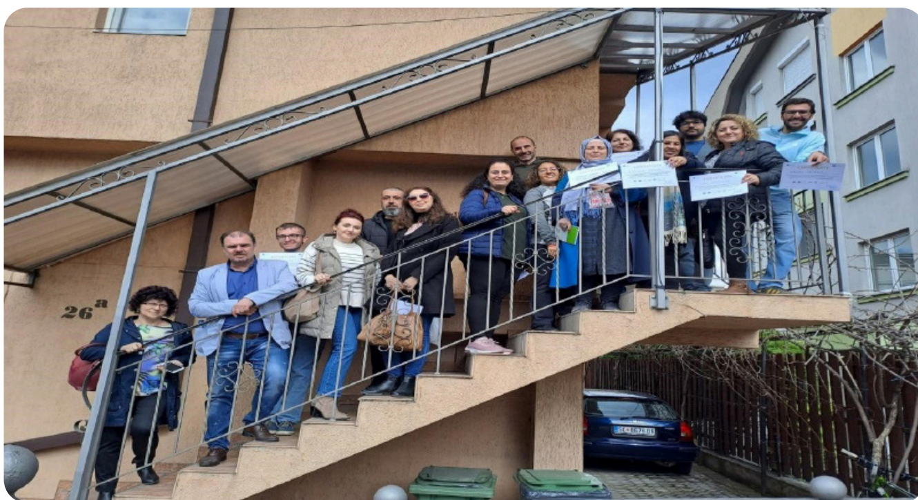
Figura 1. Primo incontro del progetto a Skopje il 21 e 22 marzo 2023

I partner delle sei organizzazioni si sono incontrati a Skopje il 21 e 22 marzo 2023 per la prima volta. Durante l'incontro, i partner hanno presentato e pianificato le prossime attività del progetto, anche il piano di comunicazione, il piano di gestione della qualità e dei rischi, nonché i ruoli di ciascun partner per portare avanti le attività del progetto.